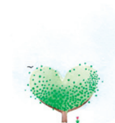
Logo: Frida Linnéa Näse ©

Utveckling av arbetslag / Organisationsutveckling gäller en arbetsplats och dess arbetslag eller personal som helhet.